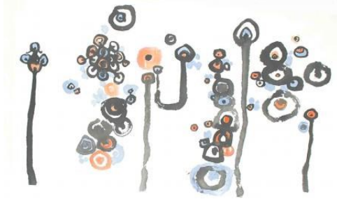
Camille Frossard: L'Ange noir, 2012, encre sur papier de chine