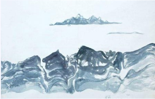
Camille Frossard L'île Riou, 2012, aquarelle sur papier japonais

Le Pôle Jeunes Adultes est un dispositif à destination :